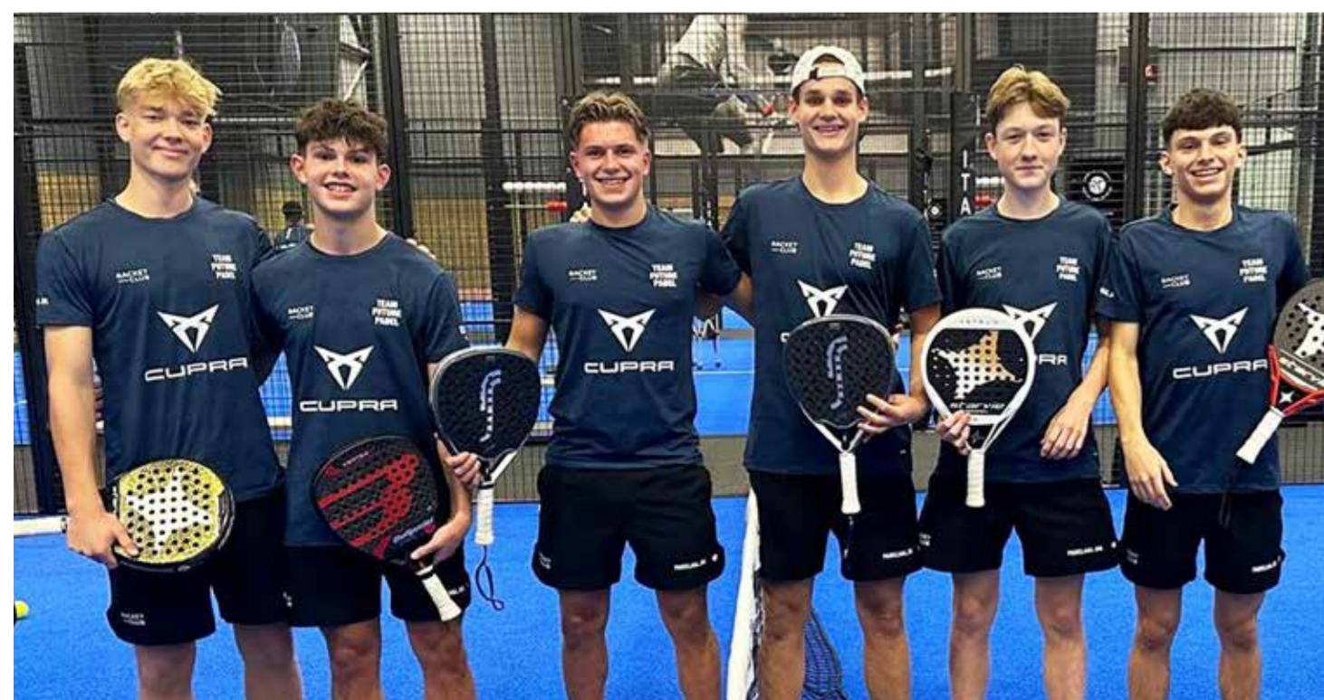
Der skal sættes på de unge.