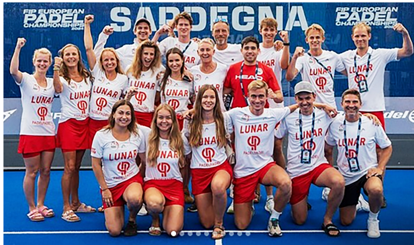
De danske EM spillere.

Spanien er verdens stærkeste padel-nation og det satte de spanske hold en tyk streg under efter at både herre- og damerækken blev vundet i overlegen stil. De italienske hold gør store fremskridt, men måtte tage til takke med sølvmedaljerne i begge rækker; der er stadig et godt stykke vej før de andre holde kan udfordre Spanien, men især Italien, Frankrig og Portugal er godt på vej.