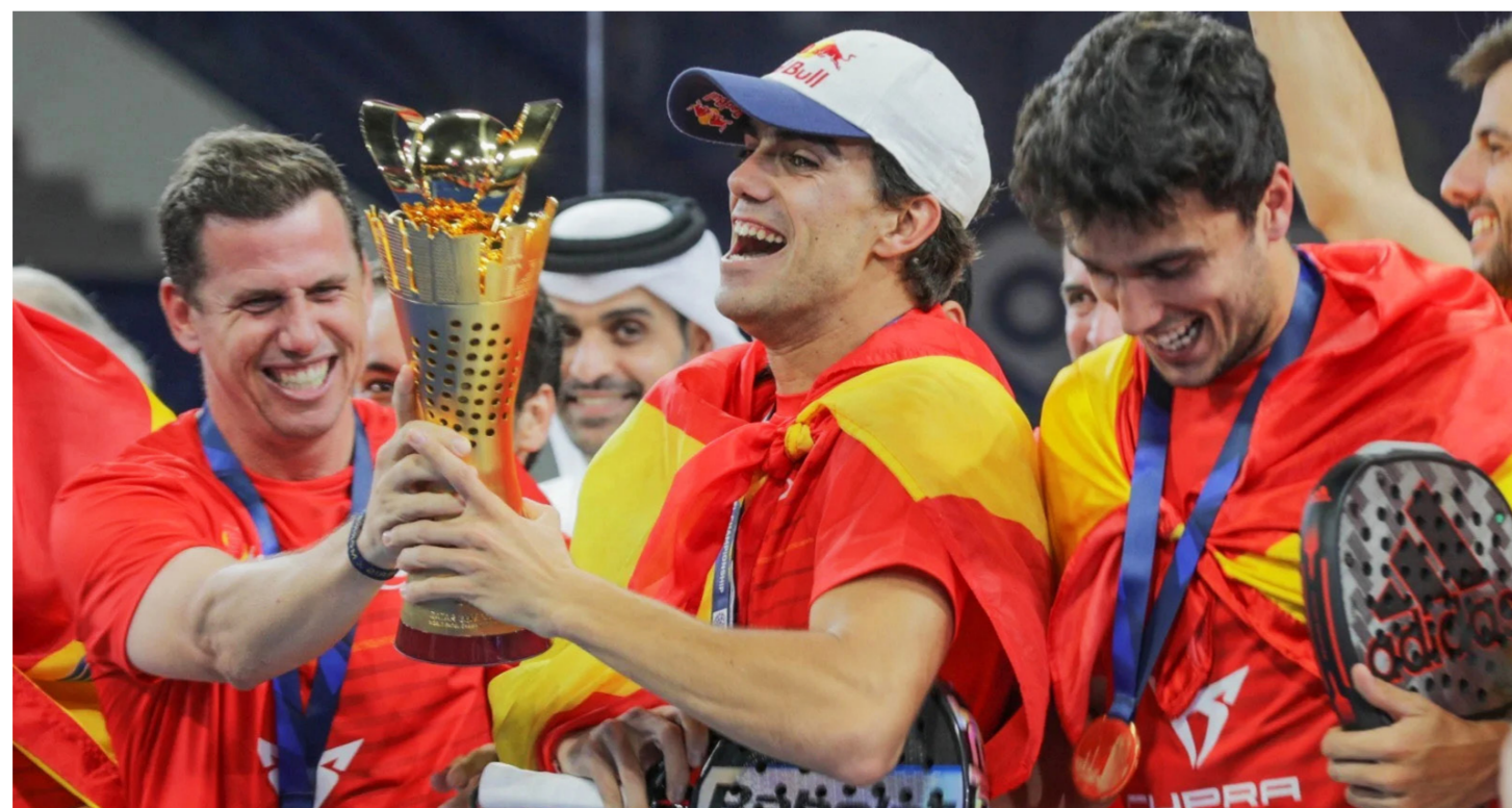
Spanien er suveræne i padel.